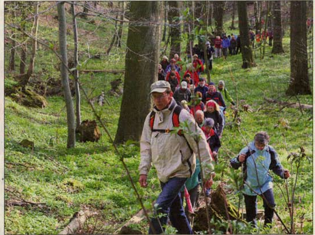
Zwischenzeitlich waren Waldstücke zu passieren.

Nach über 15 Kilometer Marsch in Bornhagen angekom-